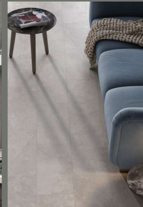
ROOMSCENE: GRAND CANYON SILVER 30X60 CM.