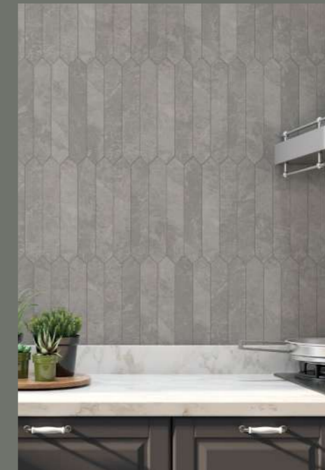
ROOMSCENE: MOS GRAND CANYON PICKET GREY 29,7X29,7