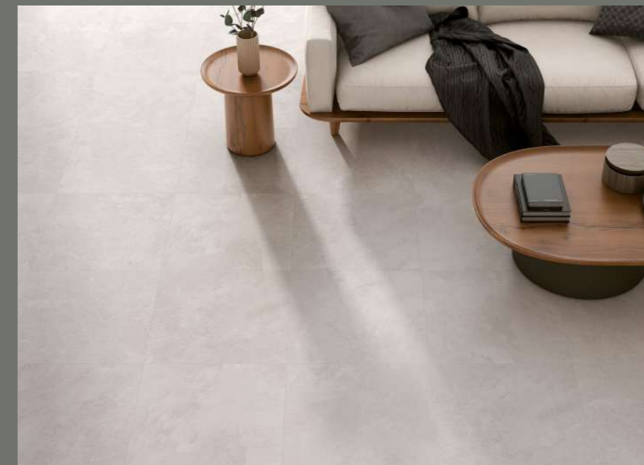
ROOMSCENE: GRAND CANYON WHITE 60X60 CM.