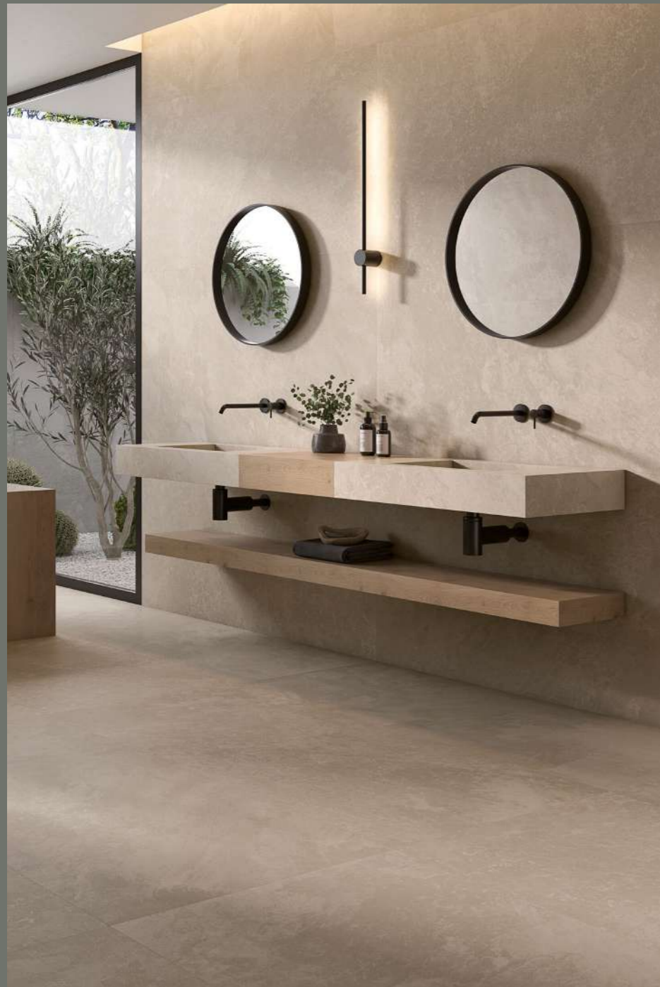
ROOMSCENE: GRAND CANYON SAND 75X150 CM.