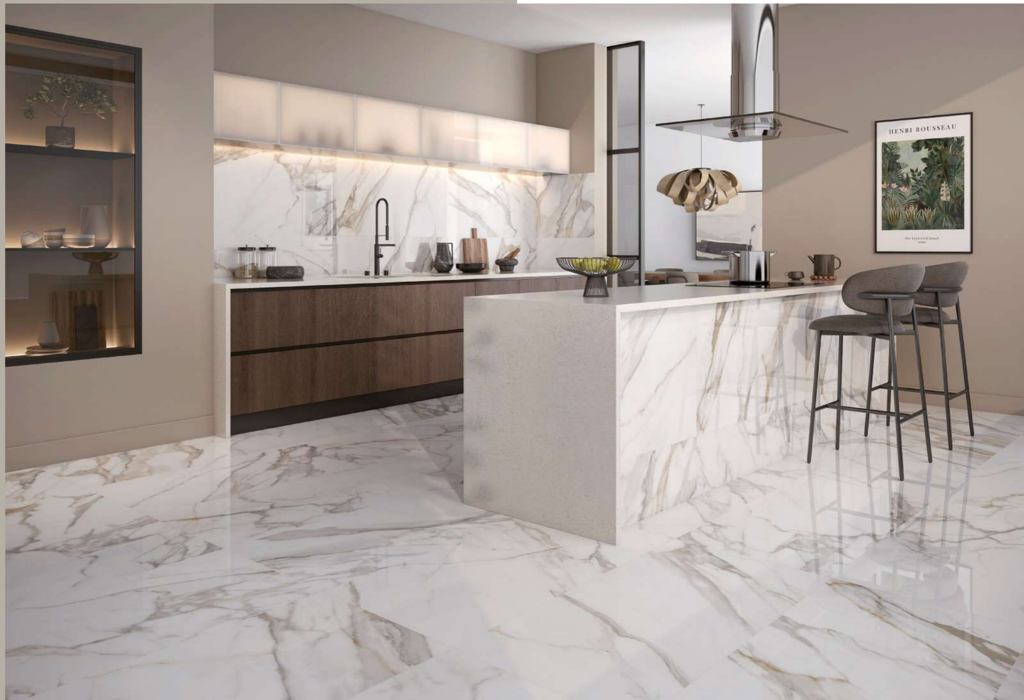
ROOMSCENE: CALACATTA ORO 60X120 CM.